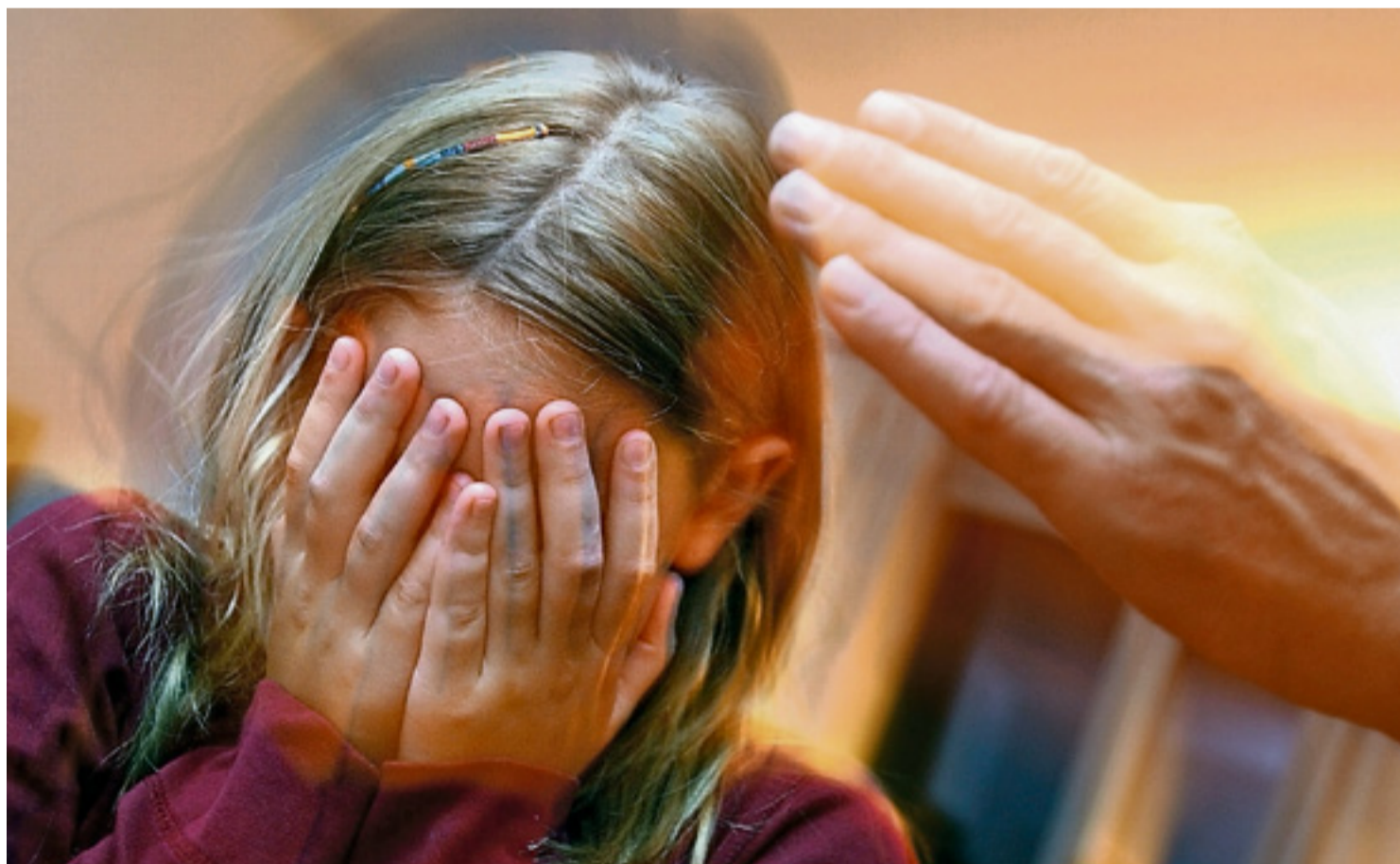
Oft suchen Kinder die Schuld bei sich, wenn sie von ihren Eltern geschlagen werden, und erzählen niemandem von ihren Sorgen.